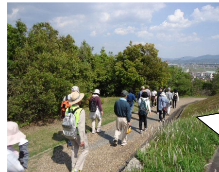
<5月 ウォーキング大会の様子>