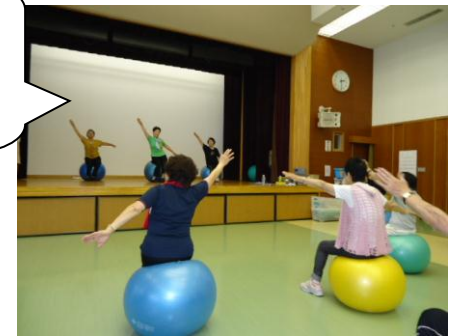
<7月 健康体操の様子>

No.39：明野・深緑と清源池コースを歩きました。緑豊かな中を歩き、風が心地良かったです。