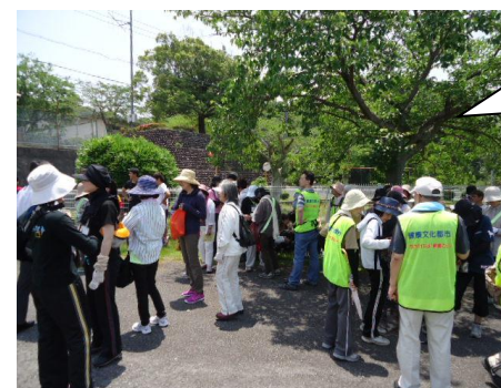
<スマイルウォーキングの様子>

No.39：明野・深緑と清源池コースを歩きました。緑豊かな中を歩き、風が心地良かったです。